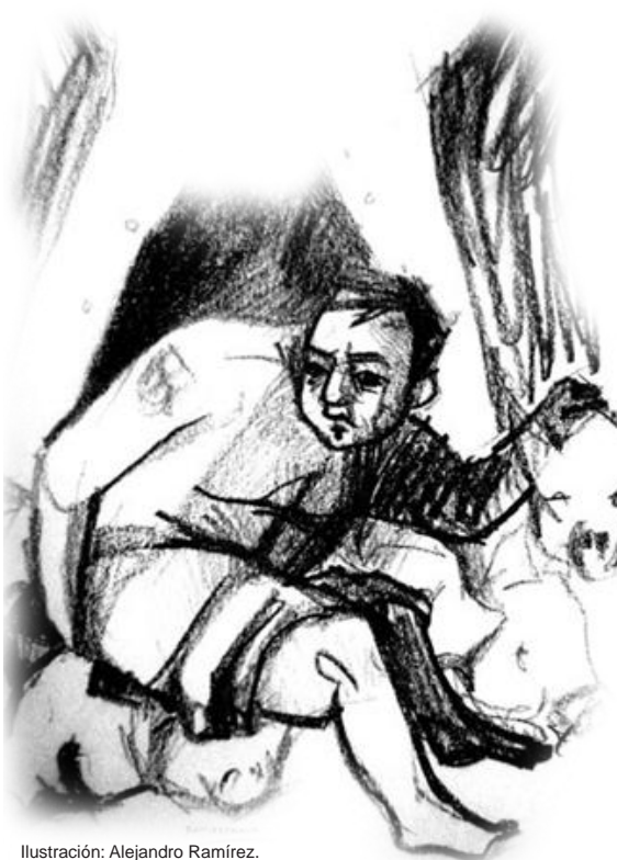
Ilustración: Alejandro Ramírez.

Más recientemente se puede hablar de un tercer modelo, claramente inscrito en el análisis del discurso. Para Peter Torop,