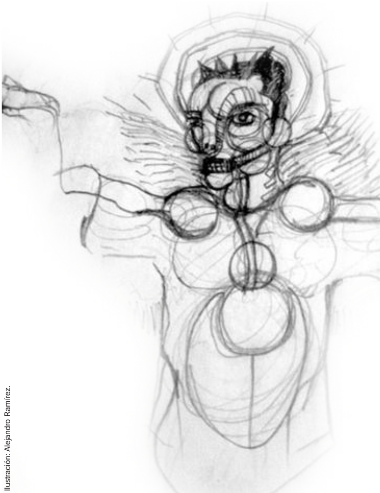
Ilustración: Alejandro Ramírez.

Los componentes formales que están presentes en la compleja experiencia de leer un libro ilustrado para niños son los siguientes: secuencialidad inicial / secuencialidad interior / gradiente icónico / connotaciones formales / gradiente lúdico / alusio-