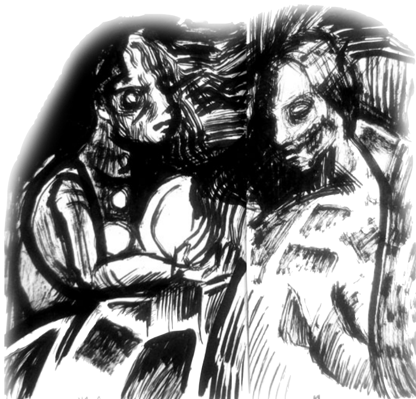
Ilustración: Alejandro Ramírez.

Los componentes formales (en la forma del contenido) en la experiencia estética de leer una historieta son los siguientes: inicio / diseño / trazo / color / narración / género / lenguaje / intertexto / ideología / final . Éstos son los componentes que es necesario estudiar para establecer aquello que se conserva, se transforma, se elimina o se añade en el proceso de la traducción de una historieta a una película. Por su parte, las formas de la narrativa