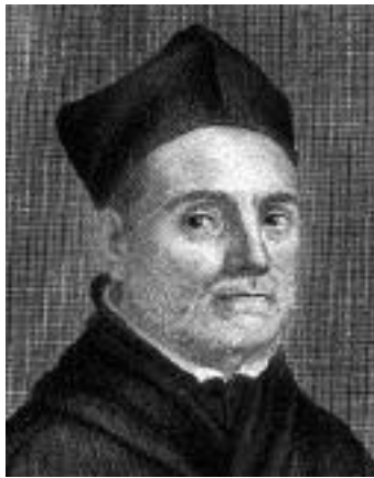
Athanasius Kircher, SJ

La linterna mágica fue un aparato óptico, precursor del cinematógrafo. Su invención se debe al jesuita alemán Athanasius Kircher, quien en el siglo XVII, y basándose en el diseño de la cámara oscura, la cual recibía imágenes del exterior haciéndolas visibles en el interior de la misma, pensó en invertir este proceso y llevar las imágenes de dentro a afuera.